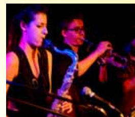
Neue Jazzschool München e.V.